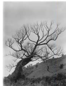
Ficus wightiana, Yakushima 26/02/1914 AAE 03201

写真を提供していただいた方々の方からこのイベントへの御祝いのメッセージをいただきました。ウィリアム（ネッド）フリードマン ハーバード大学アーノルド植物園園長/アーノルド植物学・進化生物学教授 リサ E. ヒヤソン 図書館・資料館館長