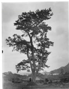
Pinus thunbergii with village, Shikogo, Yakushima 26/02/1914 AAE 03195