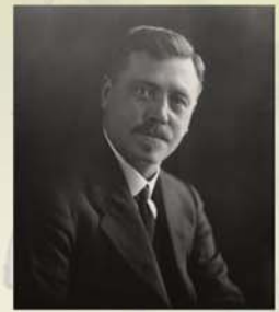
ウィルソン肖像(1876-1930)

そこには暮らしと共にあった植物を通して、消えゆく時代を愛おむ撮影者の眼差しが感じられます。ウィルソンの人物像、採集された植物標本、現在につながる琉球植物誌の系譜に合わせて、同じポイントから撮影した現在写真もご紹介します。自然環境や生活文化の変化とともに、ウィルソンが私たちに残したメッセージに思いを馳せていただければと思います。